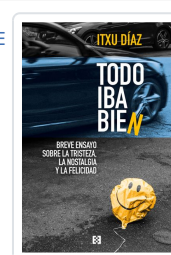
TODO IBA BIEN DÍAZ, ITXU