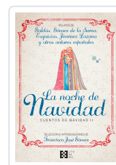
LA NOCHE DE NAVIDAD. CUENTOS DE NAVIDAD II GÓMEZ FERNÁNDEZ, FRANCISCO JOSÉ