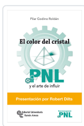
EL COLOR DEL CRISTAL GODINO ROLDÁN, PILAR