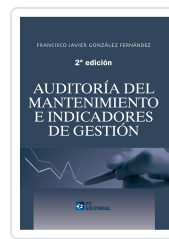
AUDITORÍA DEL MANTENIMIENTO E INDICADORES DE GESTIÓN. 2ª ED. FRANCISCO JAVIER GONZÁLEZ FERNÁNDEZ