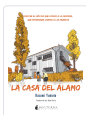
LA CASA DEL ÁLAMO YUMOTO, KAZUMI