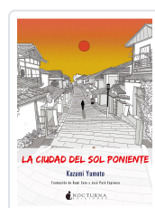
LA CIUDAD DEL SOL PONIENTE YUMOTO, KAZUMI