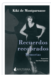
RECUERDOS RECUPERADOS. MEMORIAS KIKI DE MONTPARNASSE