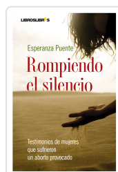
ROMPIENDO EL SILENCIO ESPERANZA PUENTE