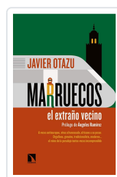
MARRUECOS, EL EXTRAÑO VECINO OTAZU ELCANO, JAVIER