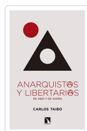
ANARQUISTAS Y LIBERTARIOS DE AHÍ Y DE AHORA TAIBO, CARLOS