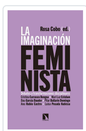
LA IMAGINACIÓN FEMINISTA COBO ED., ROSA