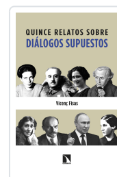
QUINCE RELATOS SOBRE DIÁLOGOS SUPUESTOS FISAS ARMENGOL, VICENÇ