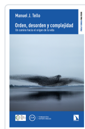
ORDEN, DESORDEN Y COMPLEJIDAD J. TELLO, MANUEL