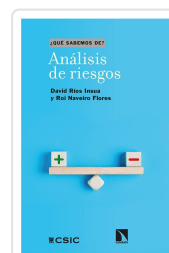
ANÁLISIS DE RIESGOS RÍOS INSUA, DAVID/NAVEIRO FLORES, ROI