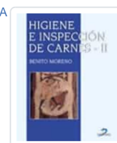
HIGIENE E INSPECCIÓN DE CARNES-II MORENO, B.