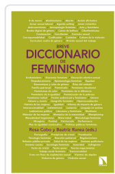
BREVE DICCIONARIO DE FEMINISMO COBO BEDIA, ROSA / RANEA TRIVIÑO, BEATRIZ