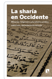
LA SHARÍA EN OCCIDENTE BACKENKÖHLER CASAJÚS, CHRISTIAN J.