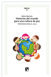
HISTORIAS DEL MUNDO PARA UNA CULTURA DE PAZ BARREIRO, HÉCTOR