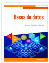
BASES DE DATOS POSTIGO PALACIOS, ANTONIO