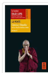
LA MENTE (CIENCIA Y FILOSOFÍA EN LOS CLÁSICOS BUDISTAS INDIOS, VOL. II) LAMA, DALÁI