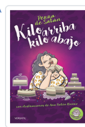
PERRA DE SATÁN, KILO ARRIBA, KILO ABAJO PERRADESATÁN