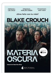
MATERIA OSCURA CROUCH, BLAKE