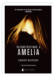
RECONSTRUYENDO A AMELIA MCCREIGHT, KIMBERLY