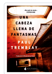
UNA CABEZA LLENA DE FANTASMAS TREMBLAY, PAUL