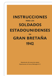
INSTRUCCIONES PARA LOS SOLDADOS ESTADOUNIDENSES EN GRAN BRETAÑA, 1942 DEPARTAMENTO DE GUERRA