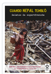
CUANDO NEPAL TEMBLÓ VARIOS AUTORES