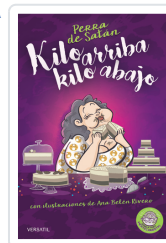
PERRA DE SATÁN, KILO ARRIBA, KILO ABAJO PERRADESATÁN