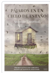
PÁJAROS EN UN CIELO DE ESTAÑO ANTONIO TOCORNAL