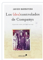
LOS (DES)CONTROLADOS DE COMPANYYS JAVIER BARRYCOA