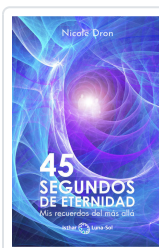
45 SEGUNDOS DE ETERNIDAD DRON, NICOLE