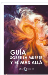
GUÍA SOBRE LA MUERTE Y EL MÁS ALLÁ DRON, NICOLE