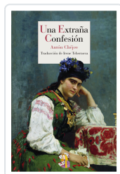
UNA EXTRAÑA CONFESIÓN CHÉJOV, ANTÓN