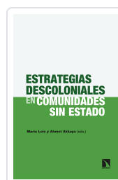
ESTRATEGIAS DESCOLONIALES EN COMUNIDADES SIN ESTADO LOIS, MARÍA / AKKAYA, AHMET