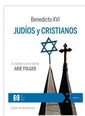
JUDÍOS Y CRISTIANOS BENEDICTO XVI