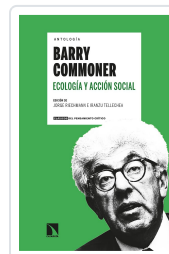
ANTOLOGÍA BARRY COMMONER. ECOLOGÍA Y ACCIÓN SOCIAL RIECHMANN, JORGE/TELLECHEA, IRANZU