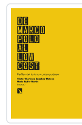
DE MARCO POLO AL LOW COST MARTÍNEZ SÁNCHEZ-MATEOS, HÉCTOR/RUBIO MARTÍN, MARÍA