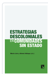
ESTRATEGIAS DESCOLONIALES EN COMUNIDADES SIN ESTADO LOIS, MARÍA / AKKAYA, AHMET