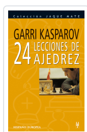
24 LECCIONES DE AJEDREZ KASPAROV, GARI