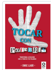
TOCAR CON PALABRAS LLADÓ MICHELI, ENRIC