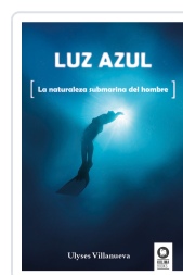
LUZ AZUL VILLANUEVA TOMAS, ULYSES