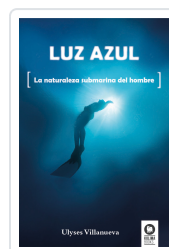
LUZ AZUL VILLANUEVA TOMAS, ULYSES