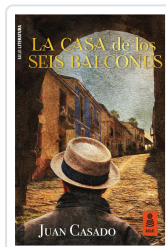
LA CASA DE LOS SEIS BALCONES CASADO FLORES, JUAN