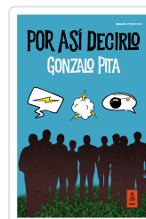
POR ASÍ DECIRLO PITA, GONZALO