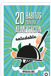
20 HÁBITOS PARA UNA ALIMENTACIÓN SALUDABLE RUIZ GÓMEZ, AMPARO