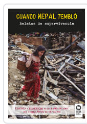
CUANDO NEPAL TEMBLÓ VARIOS AUTORES