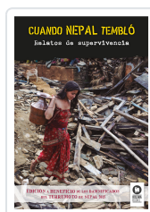
CUANDO NEPAL TEMBLÓ VARIOS AUTORES