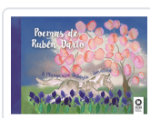
POEMAS DE RUBÉN DARÍO DARÍO, RUBÉN