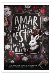
AMAR A LA BESTIA ALFONSO, NOHELIA