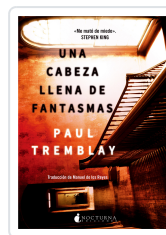
UNA CABEZA LLENA DE FANTASMAS TREMBLAY, PAUL