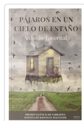
PÁJAROS EN UN CIELO DE ESTAÑO ANTONIO TOCORNAL