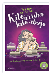
PERRA DE SATÁN, KILO ARRIBA, KILO ABAJO PERRADESATÁN