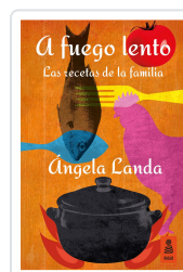
A FUEGO LENTO LANDA APARICIO, ÁNGELA