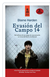
EVASIÓN DEL CAMPO 14 (5ª ED.) HARDEN, BLAINE