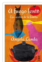
A FUEGO LENTO LANDA APARICIO, ÁNGELA