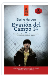
EVASIÓN DEL CAMPO 14 (5ª ED.) HARDEN, BLAINE