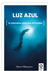
LUZ AZUL VILLANUEVA TOMAS, ULYSES