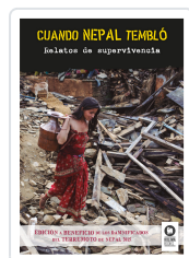
CUANDO NEPAL TEMBLÓ VARIOS AUTORES