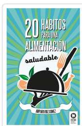
20 HÁBITOS PARA UNA ALIMENTACIÓN SALUDABLE RUÍZ GÓMEZ, AMPARO