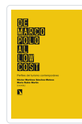
DE MARCO POLO AL LOW COST MARTINEZ SANCHEZ-MATEOS, HÉCTOR/RUBIO MARTIN, MARÍA