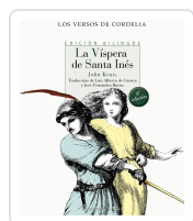
LA VÍSPERA DE SANTA INÉS KEATS, JOHN