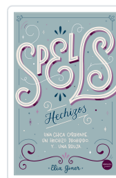
SPELLS (HECHIZOS) GINER, ELIA