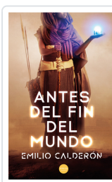
ANTES DEL FIN DEL MUNDO EMILIO CALDERÓN