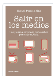
SALIR EN LOS MEDIOS PERALTA MAS, MIQUEL