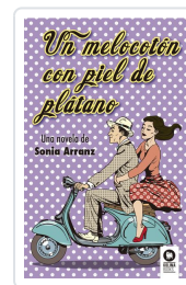
UN MELOCOTÓN CON PIEL DE PLÁTANO ARRANZ MORENO, SONIA