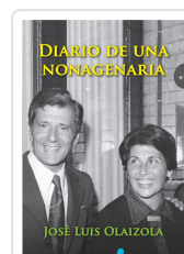
DIARIO DE UNA NONAGENARIA OLAIZOLA, JOSÉ LUIS