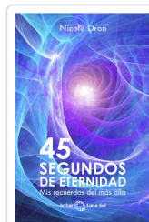
45 SEGUNDOS DE ETERNIDAD DRON, NICOLE