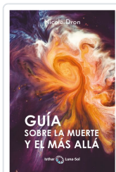
GUÍA SOBRE LA MUERTE Y EL MÁS ALLÁ DRON, NICOLE