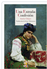
UNA EXTRAÑA CONFESIÓN CHÉJOV, ANTÓN